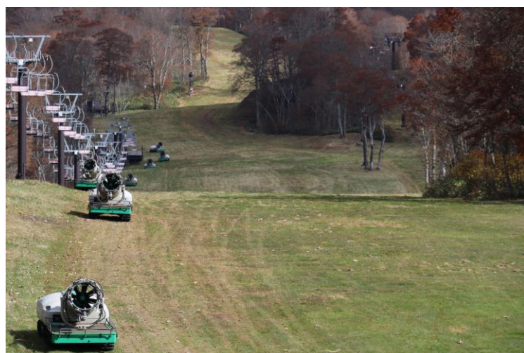
↑整備が完了し、スタンバイ中のスノーマシン