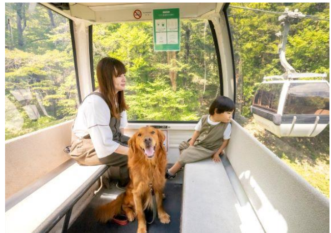
ゲージなしでゴンドラに乗車