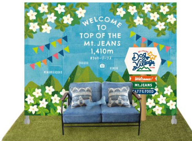
山頂カフェ内フォトスポット