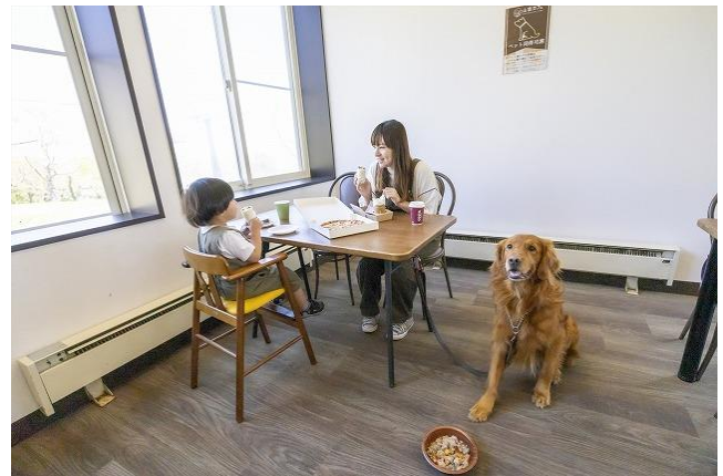
愛犬と一緒に食事