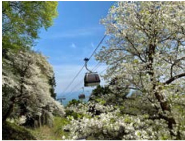
ゴヨウツツジ那須 Gondola ※2023年5月9日（火）撮影

【マウントジーンズ那須 Gondola 公式サイト】 https://www.mtjeans.com/green/