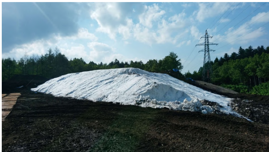
貯蔵していた雪を掘り出した様子(協力：ニセコ運輸株式会社)

開催場所：サマーゴンドラ山頂駅付近 開催期間：2024年8月2日(金)～4日(日) 開催時間：9:00～16:00(ゴンドラ運行時間に準じる) 入場料：無料(ゴンドラ乗車には料金がかかります)