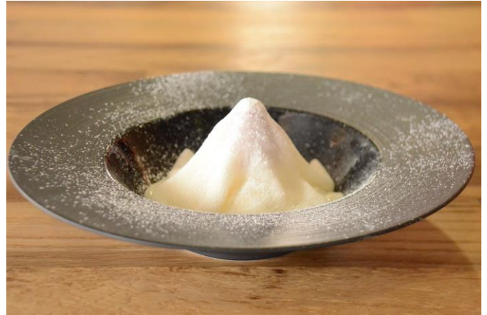
ミルクプリン雪山仕立て