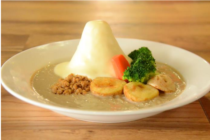
ヨウテイホワイトカレー

メニューの目玉は、「ようてい産じゃがいも」などの野菜を添え、チーズソースをかけて春の羊蹄山の雪解けをイメージした「ヨウテイホワイトカレー」(1,100円)です。またデザートには、雪をイメージし自家製ミルクプリンとバニラアイスにいちごなどをトッピング、その上から牛皮と紛糖を雪のように覆いまぶした涼しげな「ミルクプリン雪山仕立て」(780円)をご用意いたします。