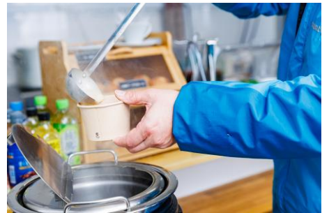
② ラウンジ内のフード等提供