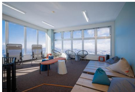
② ゴンドラ駅舎内 ラウンジ