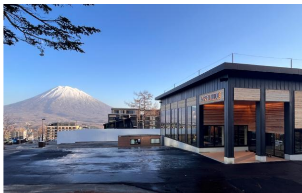
ALPEN NODE 外観

また、既存レストラン 3 店舗も北海道産の名品を世界へ発信できるラインアップへとメニューを刷新。各店での食体験を差別化し、その日の気分で“どのレストランに行こうか”と選ぶ楽しみも提供しています。単なる「ゲレ食」の域を超え、まさに「食」そのものが滞在の一つの目的となるリゾートへと進化を続けています。