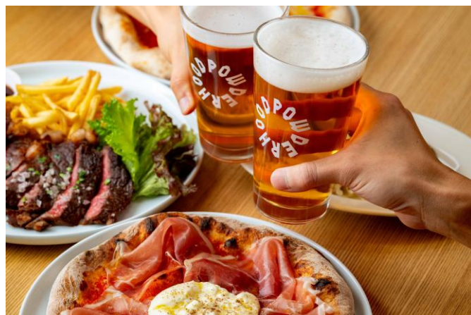
ALPEN NODE 料理イメージ