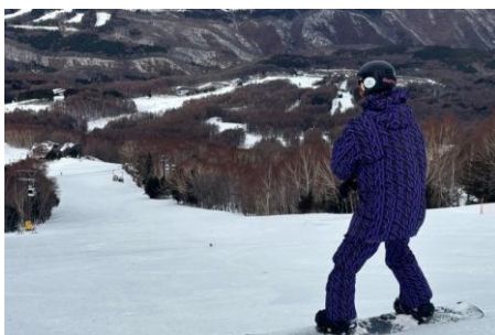
② ファーストクルージング