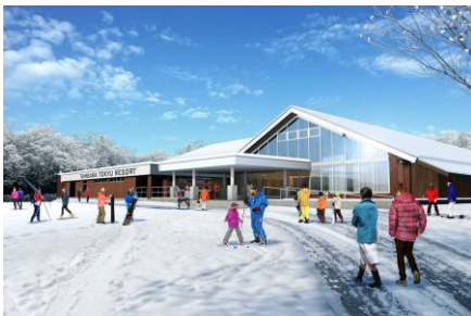
建物外観（パース画像）