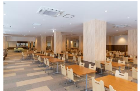
レストラン拡張エリア