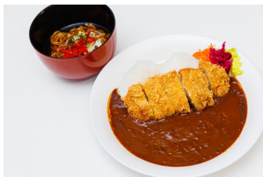
新商品のスープ焼きそばと定番のカツカレー